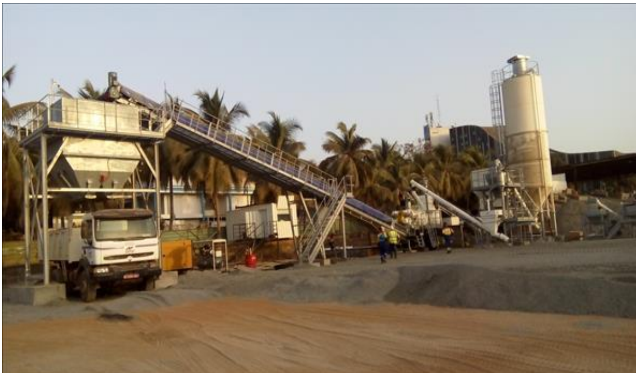
На фото – сходная установка большей мощности.

ARCSOIL CC-300B - универсальная грунтосмесительная установка производительностью 250-300 тонн в час